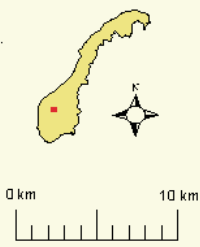
Figur 3 Kart over Jotunheimen nasjonalpark med Utladalen landskapsvernområde