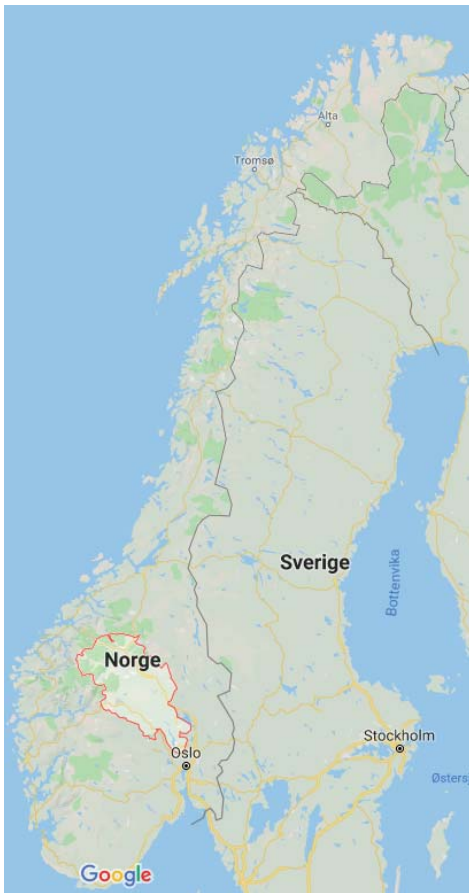
Figur 3 Kart over Norge med henvisning til Oppland fylke hvor Jotunheimen ligger