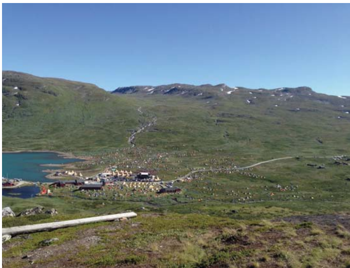
Figur 1 Privat bilde fra Vinjerock-festival